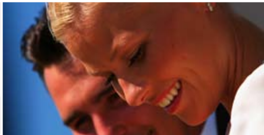
PERSONLIG UTVECKLING KUNDER & MARKNAD