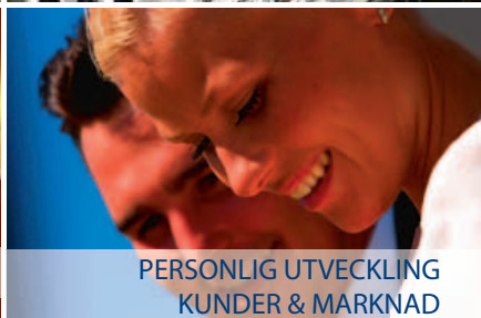
PERSONLIG UTVECKLING KUNDER & MARKNAD